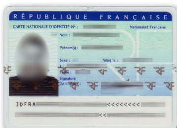
VOTRE PIÈCE D'IDENTITÉ AVEC PHOTO