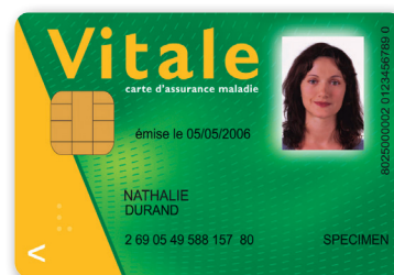
VOTRE CARTE VITALE